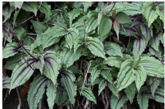
上下圖：凹唇小柱蘭

蕊柱，蕊柱很短，花粉塊 4 枚，成 2 對。分布琉球、台灣中海拔 1000-1600 公尺叢林間。在雲林、嘉義、南投等乾旱地方，會與廣葉小柱蘭、黃唇蘭(金蟬蘭)有群聚現象。葉子柔軟下垂，又叫凹唇軟葉蘭，可當花壇裝飾。相似種亮葉沼蘭( M. purpurea )其唇瓣先端深裂。