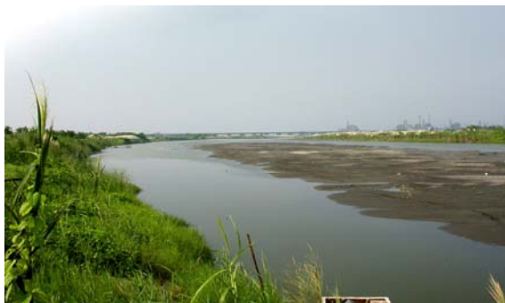
↑ 高屏溪屏東縣新園段

東半部新園段觀察要從〈雙園大橋〉下橋左轉五房村，遇到堤防往右前約 1 公里右側有間〈俊榮五金鐵工廠〉，旁邊明顯道路(福德路)及一棵苦楝樹，上左側堤防進入河床觀察，進入是一條小路喔！濕地旁有大片芒草地阻隔極為隱密，淺灘