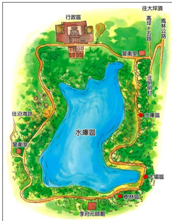
↓鳳山水庫園區路線圖