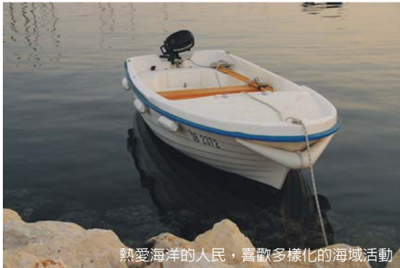
熱愛海洋的人民，喜歡多樣化的海域活動

爲一時佳話的「僞南投風景」。此三區爲狹長的海岸地形，蜿蜒的海岸線長達 1778 公里，居民沿著亞得里亞海建城，昔日也許戰略或經濟地位重要，今日卻是有名的觀光重鎮。此區因鄰近義大利，長期受其影響及通婚，居民性格熱情活潑，帥哥美女一籬筐。