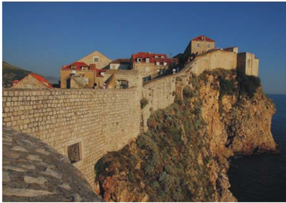
建築於石灰岩層的古城鎮，俯視亞得里亞海