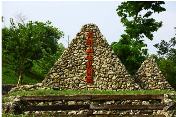
大崗山生態園區的地標

停採後，阿蓮鄉公所將千瘡百孔地貌，以治山防災經費，進行排水、崩場地治理。設置滯洪池、漂水、礦區陳列室、木棧道、鐵馬道；並廣植銀合歡、大葉合歡、鳳凰木、火焰木、耳莢相思樹、柚木、羊紫荊、艷紫荊、馬櫻丹、薑荷花。春季步道則被黃花風鈴木渲染而繽紛多彩。心涼亭最高(250公尺)，植滿整片蔓花生、松葉牡丹、雪茄花和少見的藍花楸。好涼亭(210公尺)則有香蒲、美洲闊苞菊、烏柑仔、雀梅藤、蝶豆和稀見台灣赤楊。化石涼亭直走接佬師廟，其建於1988年，「佬師」乃指佛道眾神之總稱，原為黃先生自家供養，因靈驗無比信徒增多。咾咕石在芒果樹下，自生演化群聚虎尾蘭和新歸化種長梗土丁桂。