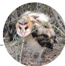
草鴞 (柯木村 攝) 文、圖 / 曾志成