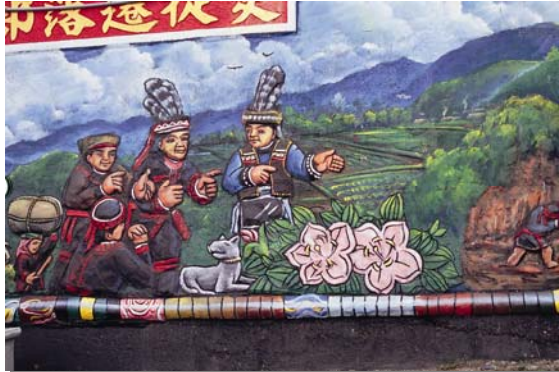
中間部落的壁畫-排灣族與野牡丹

回程由中間部落順產業道路之字形下坡，有稀少的對面花及大紅紋鳳蝶最愛的高氏馬兜鈴，平緩道路有著茂林盛產的紫斑蝶、黑脈樺斑蝶、琉球青斑蝶、三線蝶、淡紫粉蝶等。終點縣道 199 處 22 公里中間教會旁解說牌敘述：「高士村，有